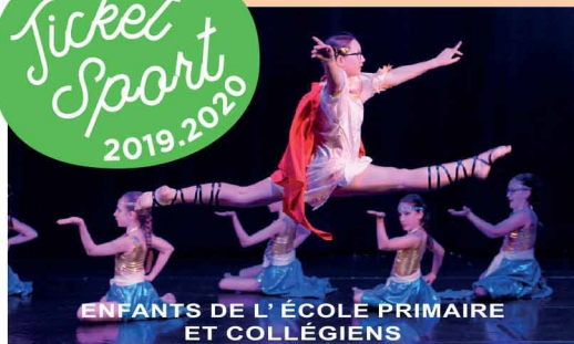
ENFANTS DE L' ÉCOLE PRIMAIRE ET COLLÉGIENS

Pratiquer du sport en bénéficiant d'une réduction de 50 € et de 10 % sur le montant global de l'inscription*